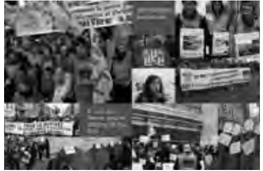
Combats au quotidien

► L'arrêté définissant les modalités et le contenu de formation , présenté en CTM le 16 novembre, ne contenait rien des garanties que la FSU attend sur les horaires, les contenus, les modalités pratiques de la formation. La FSU intervient pour que la DGSIP (1) respecte la note de cadrage actée par le cabinet le 20/07/2016. Les arguments avancés sont d'ordre financier. Pourtant, comment, à budgets constants, les crédits alloués pour deux ans de formation de CO-Psy stagiaires et un an de préparation au DEPS